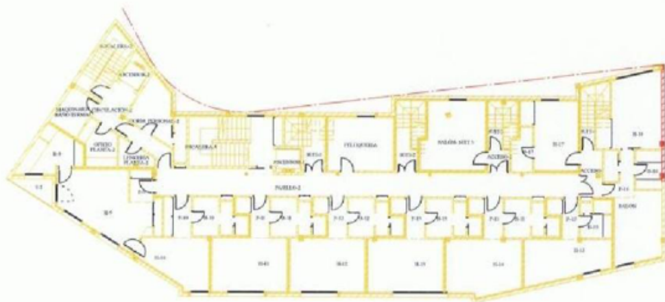
PLANTA SEGUNDA E: 1/200